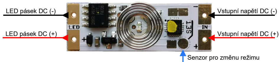
Obr.1 - Zapojení vývodů modulu stmívače

*) POZOR, tato verze je pouze na 12V. Na vyžádání můžeme toto provedení na 24V upravit, ale je to vykoupeno ztrátou odolnosti vůči přepólování napájecího napětí. Nová univerzální verze pro 12/24V bude k dispozici ke konci roku 2020.