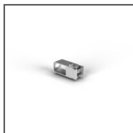
ÚCHYTKA HR-OPTI C28090N00 Ref. arch 42121