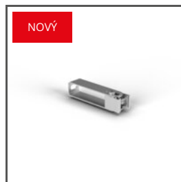
ÚCHYTKA HR-OPTI-105 C28094N00 Ref. arch 42126