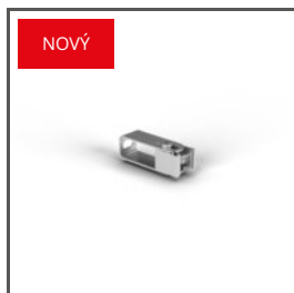
ÚCHYTKA HR-OPTI-75 C28092N00 Ref. arch 42138