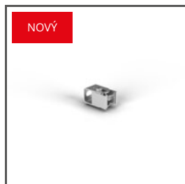
ÚCHYTKA HR-OPTI-45 C28091N00 Ref. arch 42125