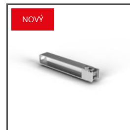
ÚCHYTKA HR-OPTI-155 C28095N00 Ref. arch 42124